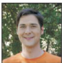
Il est américain .