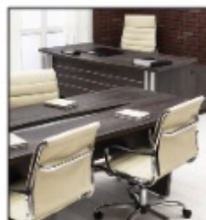
before a vowel sound

Il n'y a pas de tables dans le café. There aren't any tables in the café.