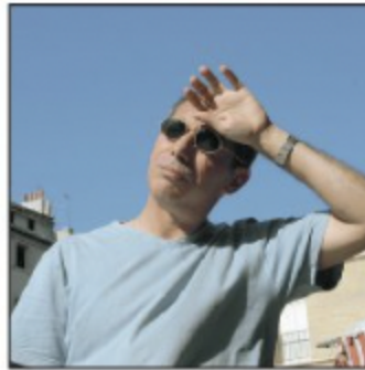
Il a chaud.