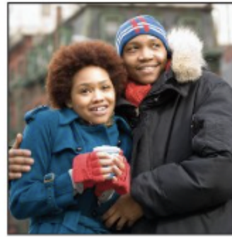
Ils ont froid.