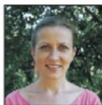
Elle est française .