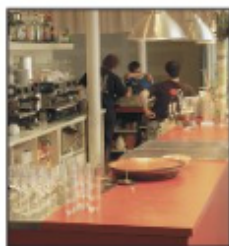
before a consonant