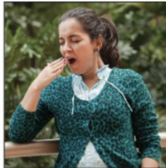
Elle a sommeil.