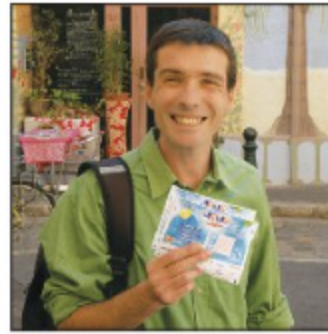
Il a de la chance.